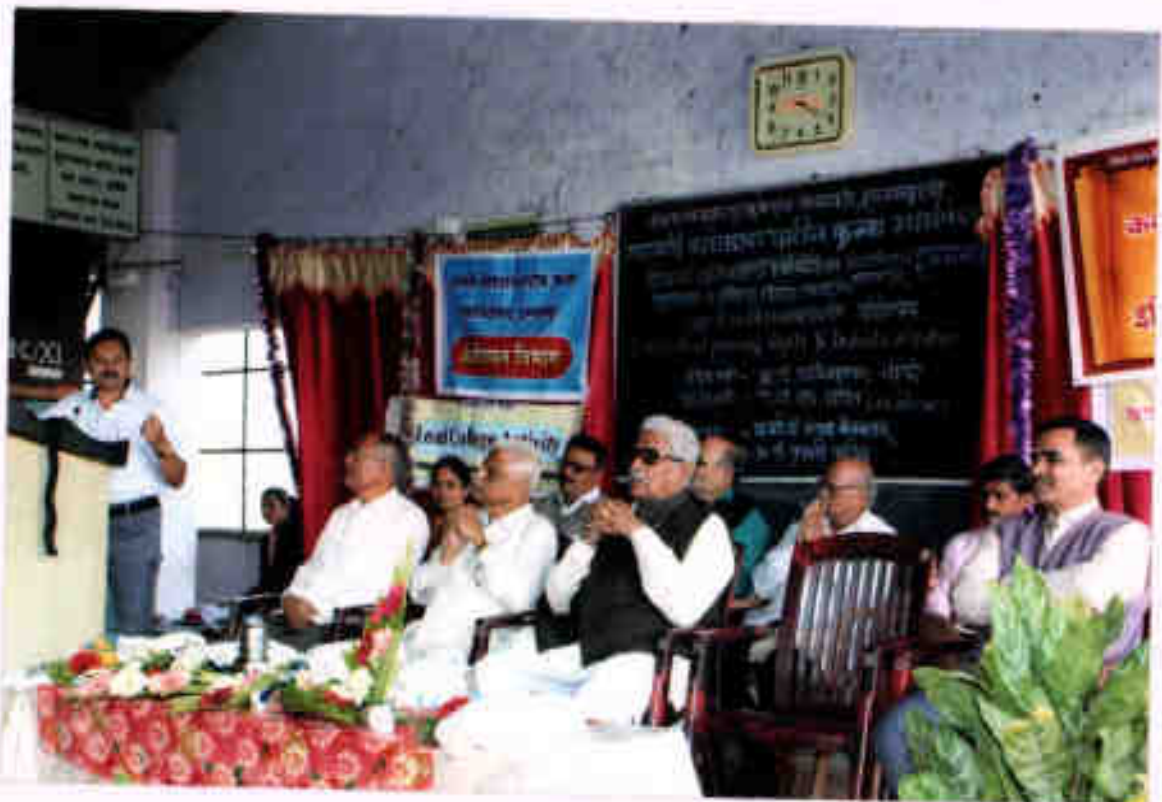
While guiding the 'Intellectual Property Rights and Industrialization' workshop,