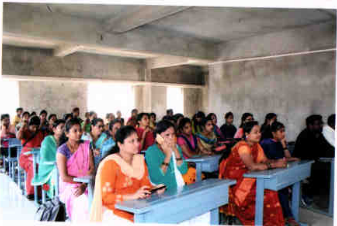
Students attending the workshop.