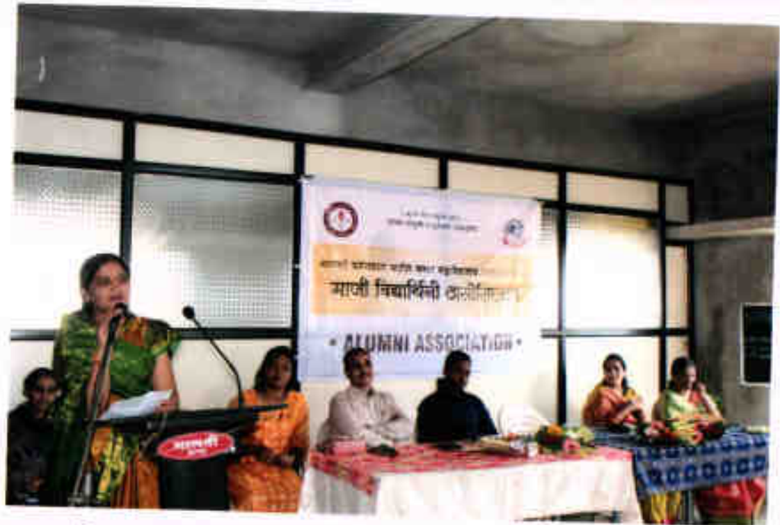
आपले विचार व्यक्त कृताना झेलोसिएशनच्या आभारंश्री डॉ. लौ. अल्लनी पाटील व शरद.