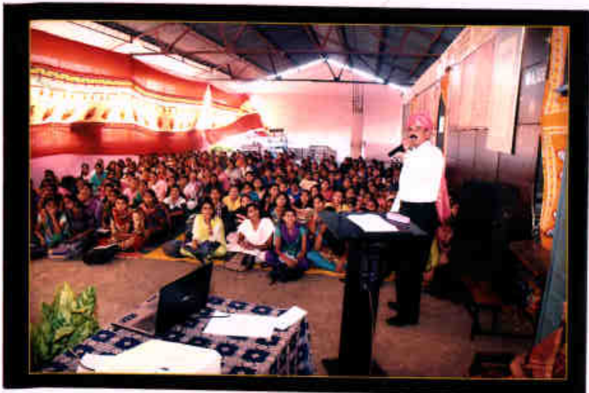
While guiding the workshop on 'Skills and Entrepreneurship Development',